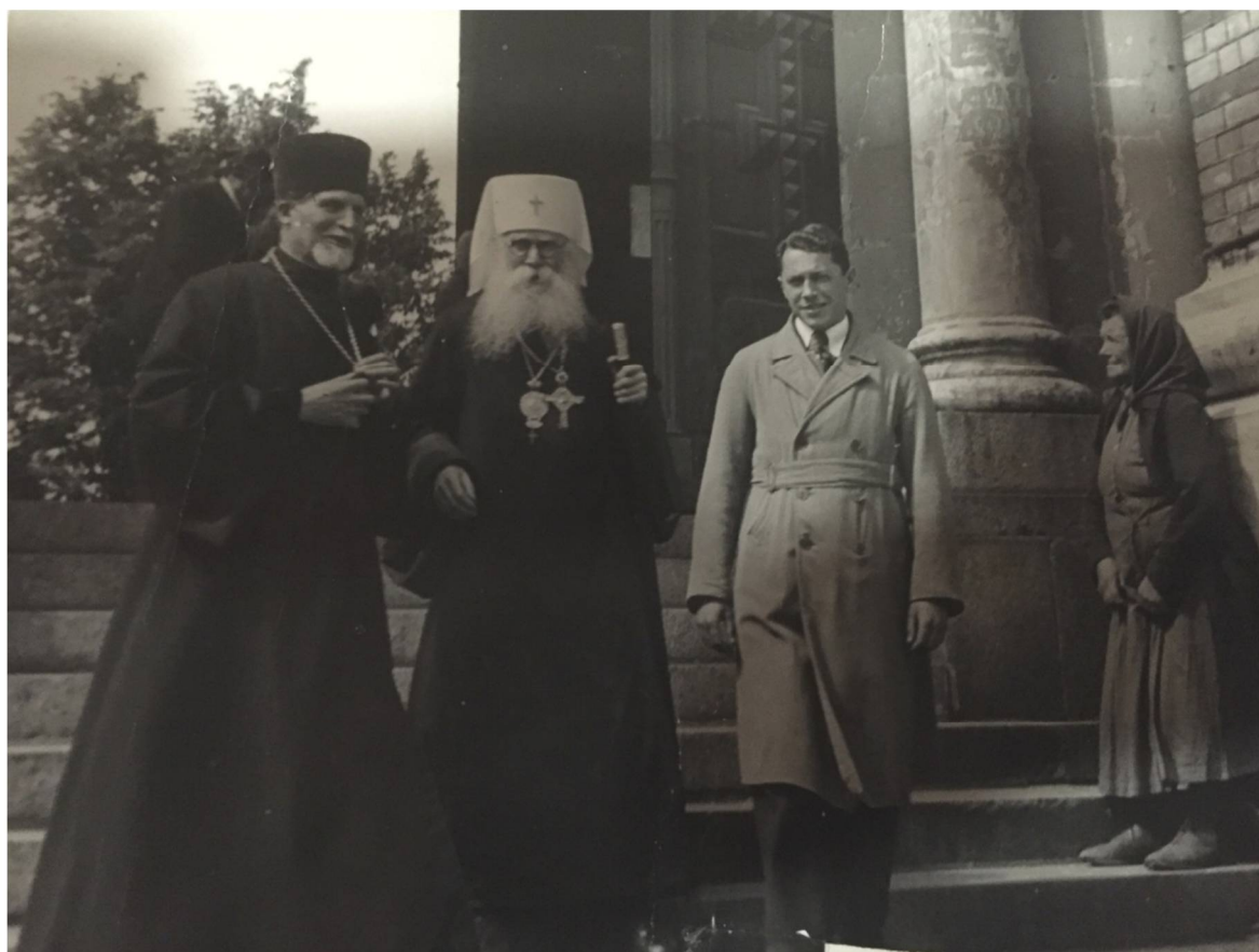
Рис. 2. Протоиерей Иоанн Намниекс (слева) и митрополит Рижский Латвийский Августин (Петерсонс) Fig. 2. Archpriest Janis Namnieks (left) and Metropolitan of Riga and Latvia Augustin (Petersons)

добного рода наград даже на излете советского режима – в 1990 г.!).