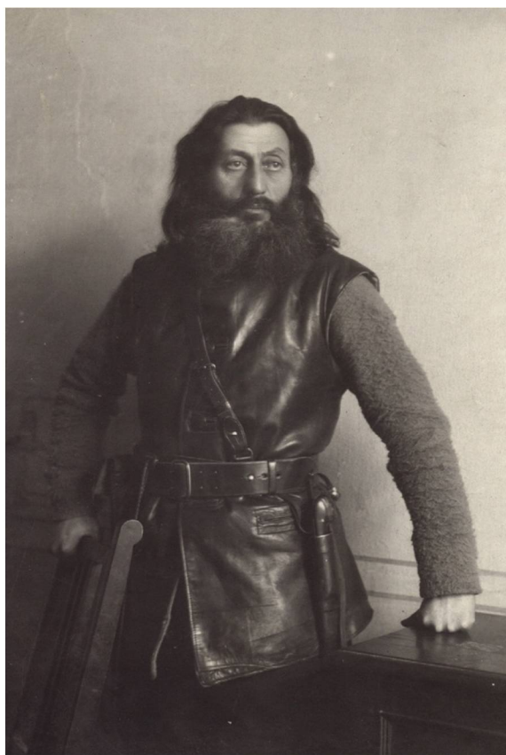
Рис. 1. Нестор Александрович Каландаришвили Fig. 1. Nestor Alexandrovich Kalandarishvili

Мадьяр Ш. Кереша из отряда Д. М. Третьякова (рис. 2) так описывает события: «Когда мы выехали на тракт, то мы увидели телефонно-телеграфный провод. У нас были аппараты. Я включил аппараты в провод. Перехватили по телеграфу ленту. Третьяков