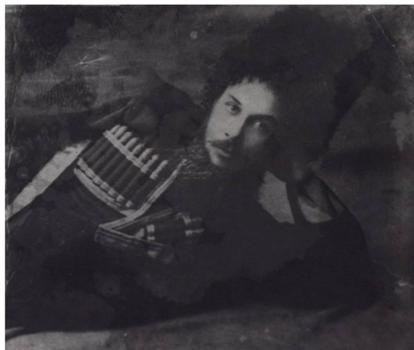
Рис. 2. Дмитрий Матвеевич Третьяков Fig. 2. Dmitry Matveyevich Tret'yakov

Подъезжает отряд, офицеры слезают и заходят в почтовое отделение. Здесь задается вопрос, а что такое сделать с Каландаришвили. Один говорит, что его нужно зарезать, другой – сжечь, и т. д. Тогда входит Каландаришвили и дает распоряжение всех обезоружить. Те смотрят во все глаза: «Как обезоружить? Мы вас встречали, а вы нас обезоружить...» Было обезоружено казачество. Каландаришвили снимает погоны и говорит: «Я Каландаришвили, я не буду вас сжигать, покажите нам только дорогу» (Государственный архив новейшей истории Иркутской области (ГАНИИО). Ф. 300. Оп. 1. Д. 566. Л. 69–70).