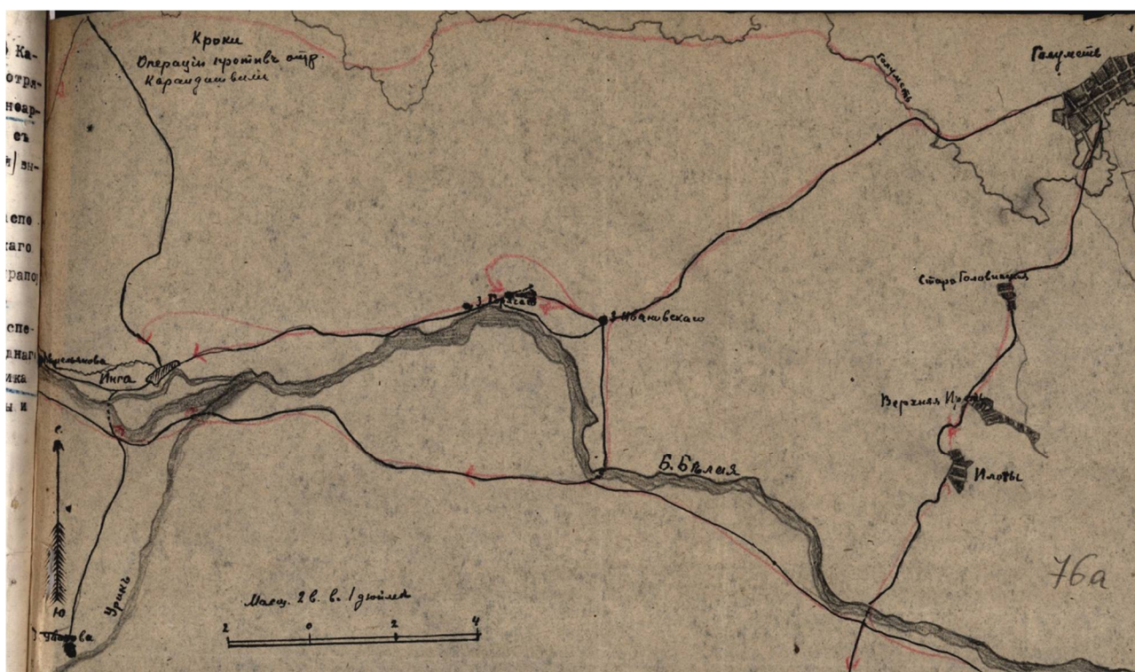
Рис. 5. Кроки (глазомерная схема) операций против отряда Каландаришвили Fig. 5. Sketch (eye-measuring scheme) of operations against the Kalandarishvili detachment

1 взвод под командой штабс-капитана Невидимова через Голуметь, Ингу на заимку Уварову, вести разведку по р. Большой Елохой.