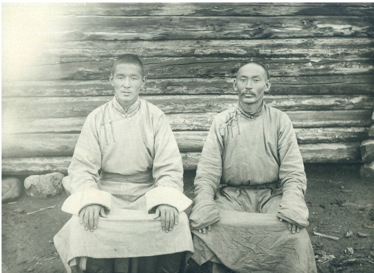
Рис. 3. Сойоты Окинского края. Сойотская экспедиция Б. Э. Петри. 1926 год. Фонды ИОКМ. Ф. 477-24