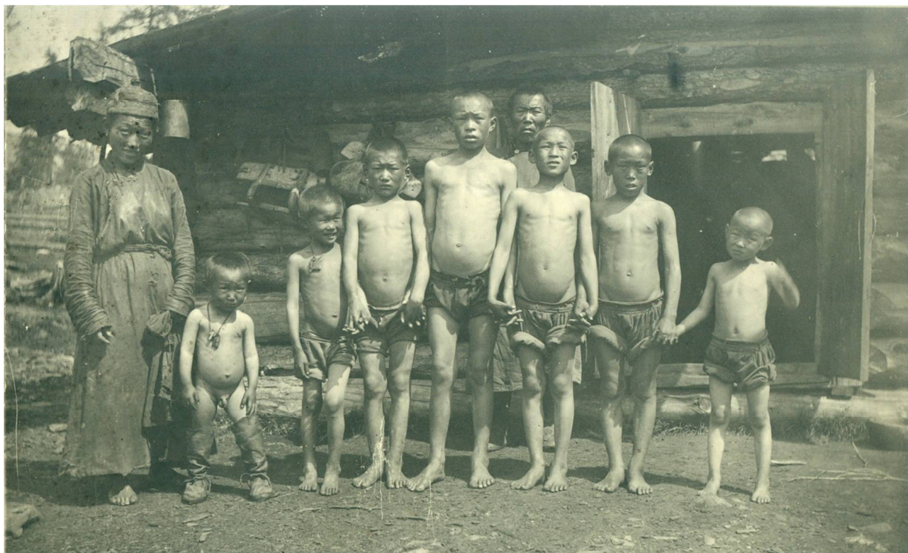
Рис. 1. Группа сойотов. Улус Улзет. Сойотская экспедиция Б. Э. Петри. 1926 год. Фонды ИОКМ. Ф. 477-63 Fig. 1. Soyot group. Ulus Ulzet. Soyot expedition B. E. Petri. 1926. Irkutsk Regional Local Lore Museum funds. F. 477-63

В опубликованном в 1927 году предварительном отчете Б. Э. Петри так определял основные итоги работы: «Процесс ассимиляции зашел уже так далеко, что ни о каком возрождении окинских сойот думать не приходится. Нам остается предоставить им окончательно раствориться в бурятской массе» (Петри, 1927. С. 19). Это был неточный вывод, так как относился к окинским сойотам, а основывался