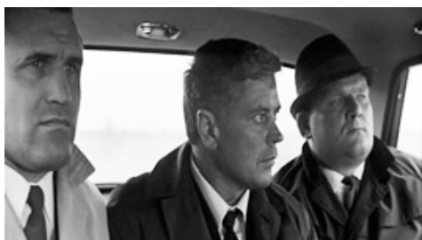
Рис. 7. Крайний слева, шестикратный чемпион РСФСР, член сборной СССР, заслуженный мастер спорта СССР по боксу, киноартист, писатель А. К. Лясота

Здесь нужно подчеркнуть, что, несмотря на успехи отдельных боксеров, этот вид спорта в Ир-