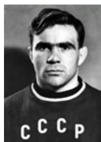
Рис. 4. Чемпион XVI Олимпийских игр в Мельбурне, бронзовый призер XVII Олимпийских игр в Риме, ЗМС СССР, Заслуженный тренер РСФСР по греко-римской борьбе, Почетный гражданин г. Иркутска К. Г. Вырупаев

В марте 1956 г. положением Комитета по физической культуре и спорту при Совете Министров СССР было учреждено звание «Заслуженный тренер СССР», что являлось для тренерского состава дополнительным стимулом для подготовки спортсменов, выступающих на международных соревнованиях. Так за успешную подготовку к участию в Олимпийских играх и за плодотворную деятельность по воспитанию спортсмена высокой ква-