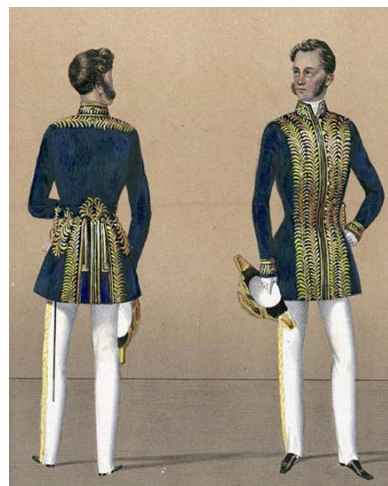
Рис. 4. Мундир Министра народного просвещения, 1856 г. Fig. 4. Uniform of the Minister of Public Education, 1856