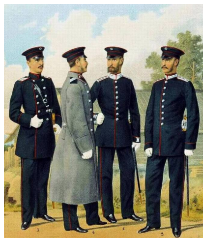
Рис. 5. Мундиры инженеров путей сообщения, 1882 г. Fig. 5. The uniforms of railway engineers, 1882