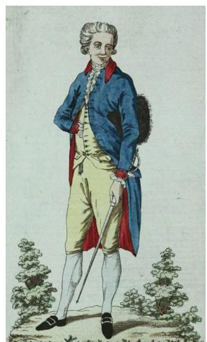
Рис. 2. Мундир Псковского наместничества, 1794 г. Fig. 2. The uniform of the Pskov governorship, 1794