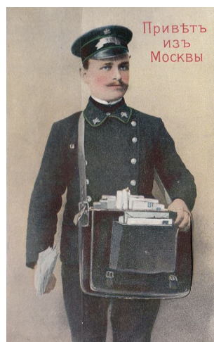
Рис. 6. Чиновник телеграфного ведомства. Открытка начала XX вв. Fig. 6. An official of the telegraph office. Postcard of the early XX centuries