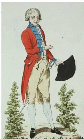
Рис. 1. Мундир Иркутского наместничества, 1794 г. Fig. 1. The uniform of the Irkutsk governorship, 1794