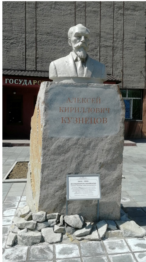
Рис. 4. Бюст А.К. Кузнецова, г. Чита Fig. 4. Portrait sculpture of A.K. Kuznetsov, Chita

И только во второй половине 1950-х годов в результате выступления в печати научно-краеведческой общественности в защиту А.К. Кузнецова, а также на волне возрождения деятельности ЗОРГО, отношение властей к этой личности изменилось (Марков С. Буйволова голова. Литературная газета. 1957. 10 января.). В 1964 г. на музейном здании была открыта мемориальная доска в честь основателей и активных деятелей Читинского отделения Русского географического общества и Читинского музея. Первым в этом списке – имя А.К. Кузнецова. В начале 1990-х гг. Читинский областной краеведческий музей вернул имя А.К. Кузнецова, стал регулярно проводить «Кузнецовские чтения». Накануне 175-летия со дня рождения А.К. Кузнецова в центре Читы установлен его бюст (декабрь 2018 г.) (рис. 4), а в день его юбилея