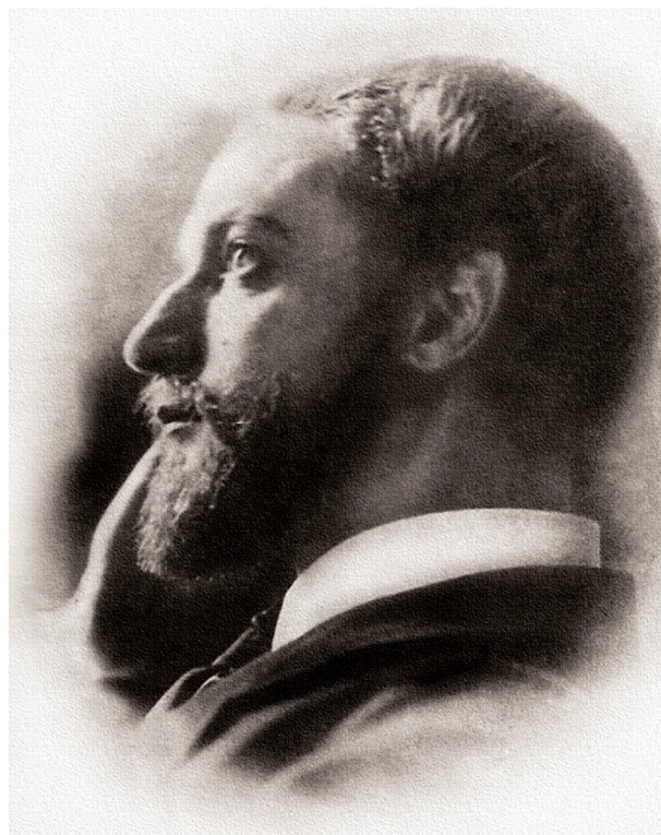
Рис. 1. Бернгард Эдуардович Петри (1884–1937) Fig. 1. Berngard Eduardovich Petri (1884–1937)

Профессиональный археолог и этнограф, академический музейный работник, приехавший в Иркутск из Петрограда в 1917 г., Б.Э. Петри (1884–1937) был основателем кафедры первобытной культуры в Иркутском университете (1918) и студенческого кружка «Народоведение». Вместе с Б.Э. Петри (рис. 1), стоявшим у истоков институционального оформления археологии в Иркутске, упомяну Константина Павловича Головкина (1873–1925), самарского купца, мецената, коллекционера, археолога, художника, который вследствие революционных событий в России в октябре 1918 г. приехал в Иркутск (рис. 2). В январе 1921 г. по их инициативе была создана Археологическая комиссия (1921–1922), целью которой было объединение всех местных археологов и любителей старины путем составления археологической карты Иркутской губернии, выступлений с рефератами и докладами и взаимному информированию на археологические темы. В течение трех месяцев