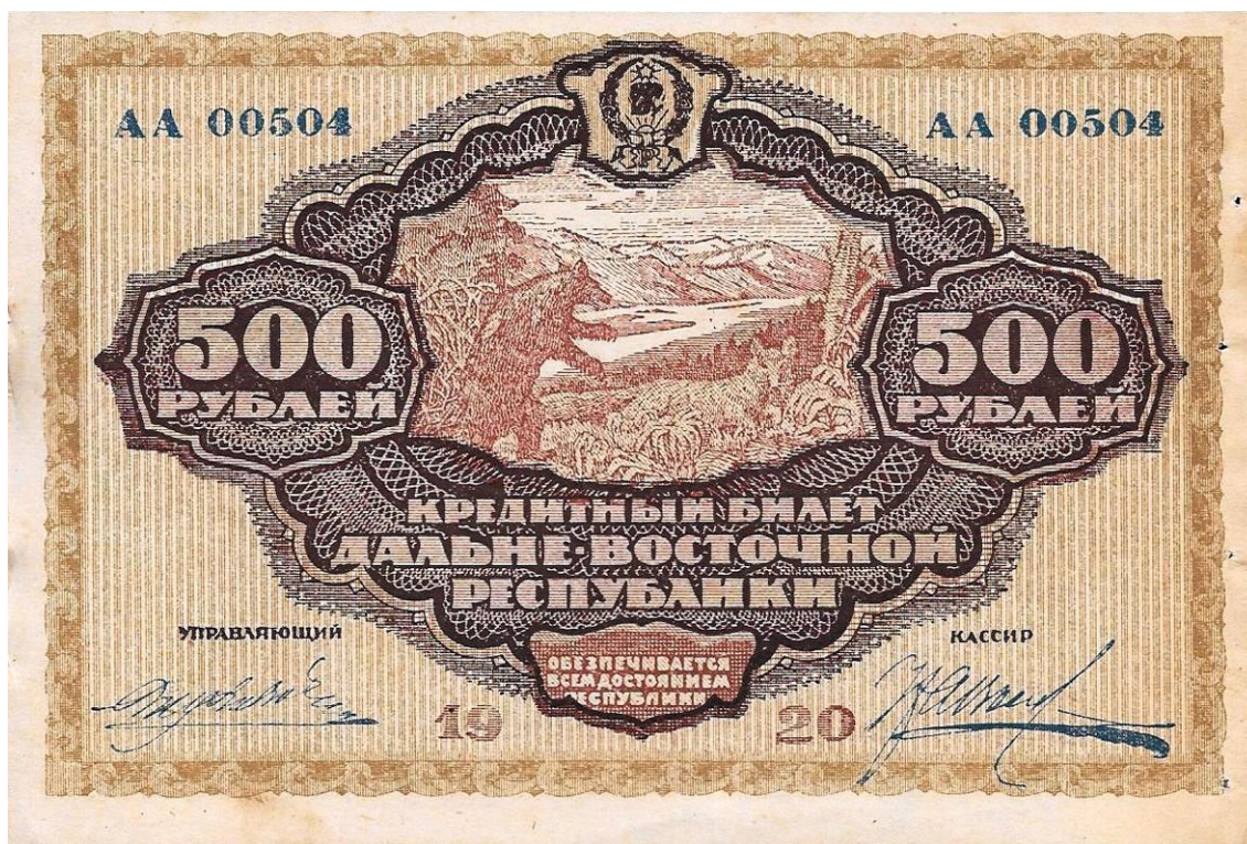
Рис. 3. Денежный знак Дальневосточной республики номиналом в 500 руб. Fig. 3. Monetary sign of the Far Eastern Republic with a nominal value of 500 rubles

После отъезда команды С.С. Ермолаева в Иркутске остались лишь старые литографические машины, на которых печатались денежные знаки для Дальневосточной республики, да и то недолго. В начале 1921 г. их передали в распоряжение Минфина ДВР. Всего в Читу были отправлены оборудование и материалы на 58, 5 тыс. руб. золотом. Вместе с ними на восток выехали 15 специалистов и 7 представителей административного аппарата (ГАИО. Ф. Р-260. Оп. 1. Д. 222. Л. 89). Распоряжением Наркомфина РСФСР от 3 апреля 1921 г. ЭЗГБ в Иркутске была полностью ликвидирована. Для ее упразднения была сформирована специальная комиссия, в состав которой вошли сотрудники самой «фабрики», Министерства финансов ДРВ и представители органов власти Иркутской губернии (финансового отдела, совнархоза, РКИ). К 1 апреля 1921 г. Иркутская ЭЗГБ полностью прекратила свою работу (Петин, 2018а. С. 132). Процедура упразднения заняла еще несколько месяцев. Все оставшееся ценное имущество и оборудование было