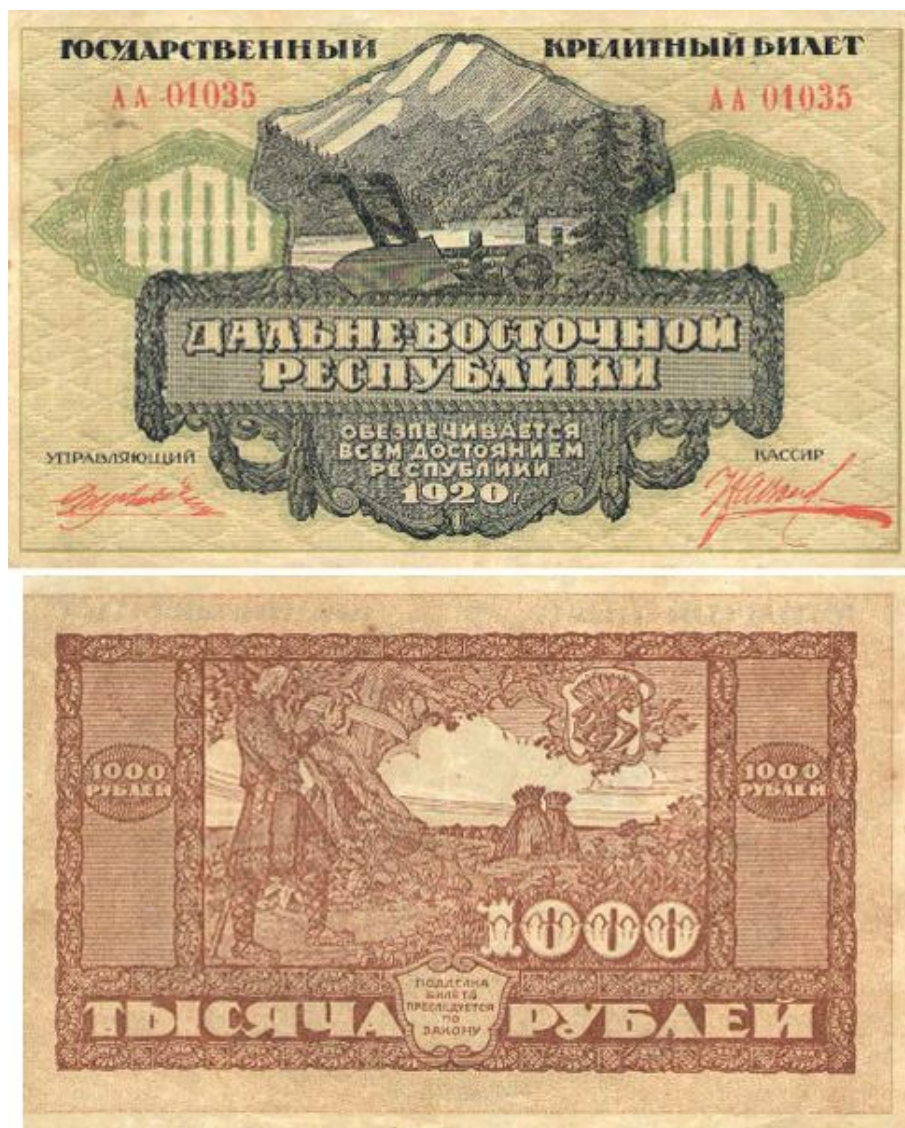
Рис. 4. Денежный знак Дальневосточной республики номиналом в 1000 руб. Fig. 4. Monetary sign of the Far Eastern Republic with a nominal value of 1000 rubles

непродолжительной деятельности ЭЗГБ в Иркутске. За период с февраля 1920 г. по апрель 1921 г. на ней было огрифовано грифом РСФСР около 83,8 млн листов облигаций и купонов к ним американского образца на сумму в 1,15 млрд руб.; грифом «Временная Земская власть Прибайкалья» – 3,7 млн листов кредитных билетов в 25 и 100 руб. на сумму 228,5 млн руб.; напечатано более 18 млн экземпляров кредитных билетов ДВР на общую сумму 3,6 млрд руб. (рис. 3; рис. 4). Кроме того, по заказам различных учреждений отпечатано более 2,6 млн продовольственных карточек, около 20 тысяч плакатов агитационного характера, 79 брошюр, 144 990 портретов вождей пролета-