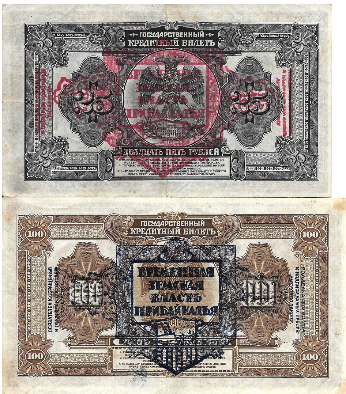
Рис. 1. Денежные знаки с грифом «Временная земская власть Прибайкалья» Fig. 1. Banknotes with the stamp "Provisional Zemstvo of the Baikal region"