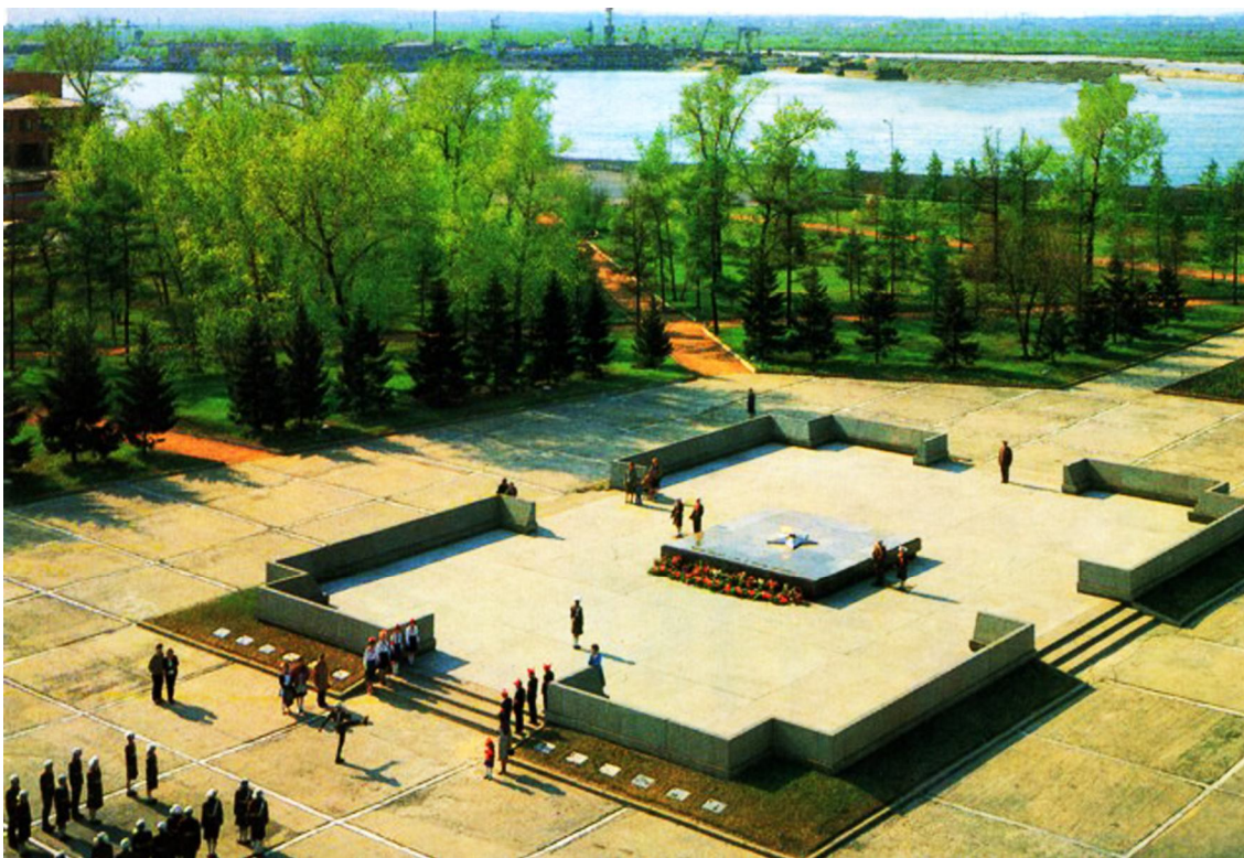
Рис. 2. Мемориальный комплекс «Вечный огонь», Иркутск, 1975, художник В.Г. Смагин Fig. 2. The memorial monument "Eternal Flame", Irkutsk, 1975, artist Vitaliy G. Smagin

В 1977 г. было завершено благоустройство прилегающей территории Мемориала «Воинам, умершим от ран в госпиталях Иркутска в 1941–1945 гг.», приуроченное к 60-летию Октябрьской Революции. Мемориальный комплекс расположен в Иркутске на улице Станиславского, состоит из памятного знака в виде стилизованной звезды с одноименным текстом, плиты с перечнем фамилий погибших – их 601, стелы и 296 надгробных плит. Автор памятного знака, главный художник города – В.Г. Смагин. «По решению облисполкома от 25 марта 1985 г. № 149 «Место захоронения воинов, умерших от ран в госпиталях Иркутска в 1941–