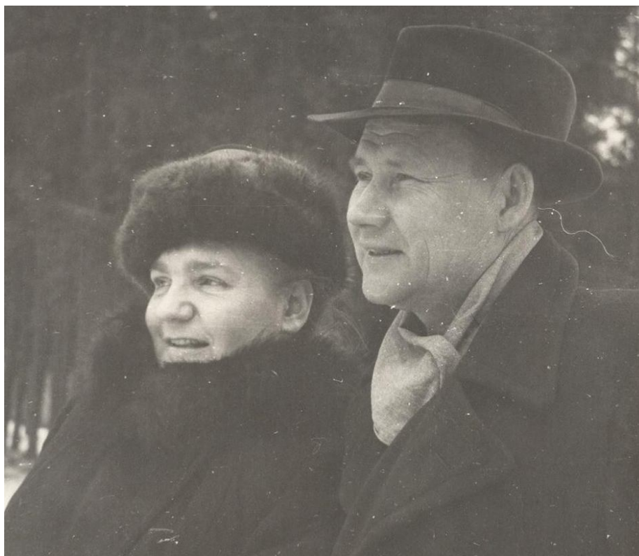
Рис. 10. В.Д. Запорожская и А.П. Окладников в пригороде Ленинграда, 1954 г. Fig. 10. V.D. Zaporozhskaya and A.P. Okladnikov in the suburb of Leningrad, 1954