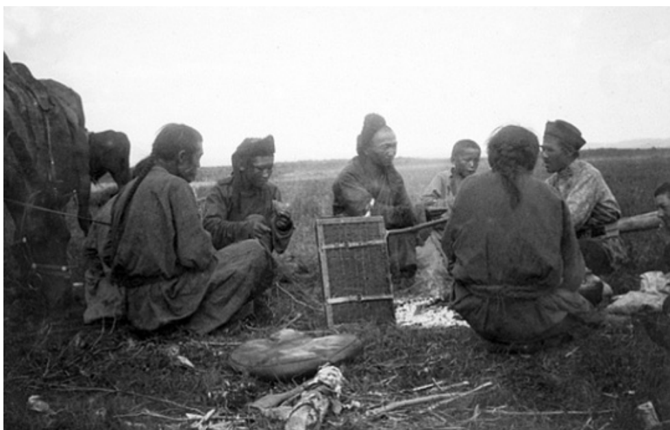
Рис. 2. Сойоты (тувинцы). Урянхайский край Fig. 2. Soyots (Tuvans). Uryanghai region

сенную глиняной стеной на четыре стороны. Около «хуре» находилось отдельное помещение князя хошуна Ван, тоже обнесенное глиняной стеной с разбитым садом из тополей. Русские фактории находились на почтительном расстоянии от «хур» и их было немного. Местность, на которой раскидывался Уланком, граничила с владениями двух хошунов – Далай хан и Ван: «Князь хошуна Далай хан находится в горах, на западе от Уланкома. Князь хошуна Вана живет здесь на “хуре”. Хотя это не из постоянных мест его пребывания – он летом кочует в горы» (ГАИО. Ф. 25. Оп. 11. Д. 29. Л. 8). Дальнейшая разведка давала характеристику расположения г. Улясутая, находящегося в долине р. Загастай: «... с севера рядом с городом невысокая гора, дальше на север высокий хребет, на юге долина Загастая и дальше горы, вообще Улясутай стоит среди больших гор, всюду видны лишь горы да камни, растительность – тощие кусты карагана, а на горах совсем ничего нет, дома в городе китайские фанзы-мазанки, с бумажными окнами и потолками, ограда – частокол из лиственничного нетолстого леса, улица узкая, торговцев около 50 фирм ... – 10 крупные, остальные мелкие, около 20 мастерских, скорняки, портные, шубники, серебряники, кузнецы и столяры. Китайские власти в Улясутае дзянь-дзюнь и два амбаня – помощника дзянь-