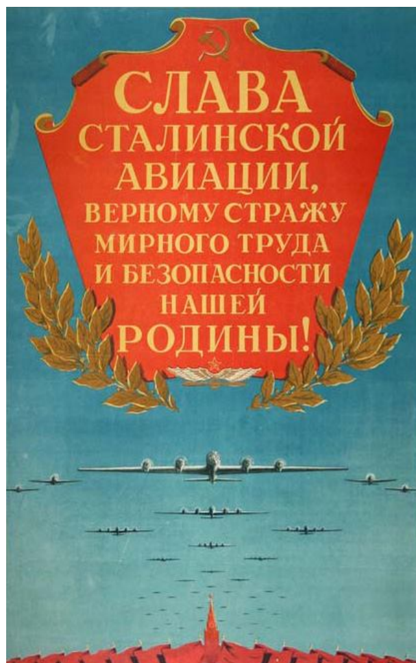
Советские плакаты Soviet posters

Оп. 1. Д. 759. Л. 50–54). Важным направлением деятельности было вручение правительственных наград демобилизованным военнослужащим и обмену временных удостоверений на постоянные орденские документы. После победы система военных комиссариатов СССР продолжала совершенствоваться с учетом ранее полученного опыта (Павловский, 1985. С. 206). Предметный анализ проблем повседневной деятельности военкоматов и государственных усилий по их предотвращению и разрешению – перспективная исследовательская задача.