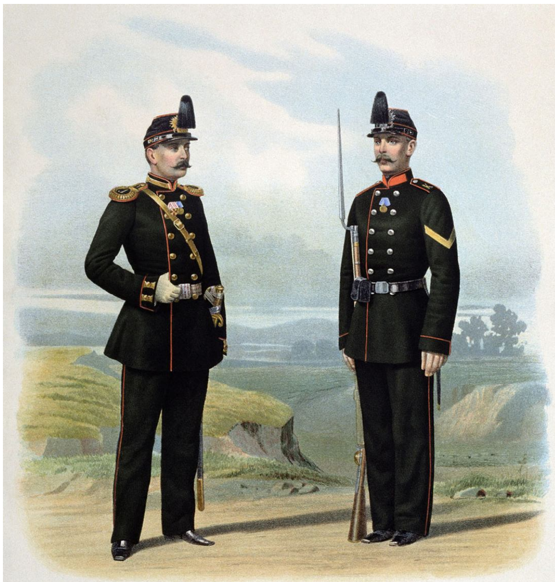
Рис. 1. Обер-офицер резервных пехотных батальонов и рядовой крепостных полков 1864 г. Fig. 1. Ober officer of the reserve infantry battalions and ordinary serf regiments in 1864

– крепостные и гарнизонные артиллерии и все команды, состоящие при хозяйственных артиллерийских учреждениях;