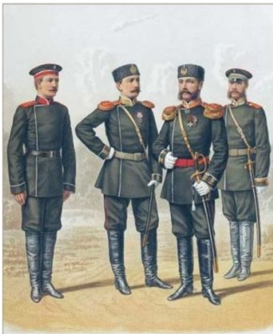
Рис. 3. Штаб-офицер, обер-офицер, фельдфебель и рядовой пехоты, 1881 г. Fig. 3. Headquarters officer, ober officer, sergeant major and infantry soldier, 1881

На основе архивных материалов можно сделать выводы о реальном положении и состоянии войск Восточно-Сибирского военного округа на