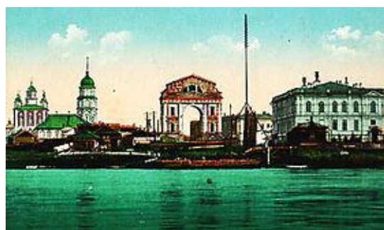
Рис. 8. Московские ворота, г. Иркутск Fig. 8. Moscow Gate, Irkutsk

Городской архив Иркутска располагался внутри Московских ворот (рис. 8). В 1870 г. он был осмотрен В.В. Птицыным. Часть этого архива уже тогда была расхищена, потому что каждый, кто имел в него доступ, выбирал нужные для себя бумаги, оставляя папки прямо на полу. К тому же Московские ворота не охранялись, и поэтому неудивительно, что постепенно фонды архива оказались почти полностью расхищены. О ценности данного архива говорят уже только названия некоторых дел: протоколы и приговоры старой Иркутской