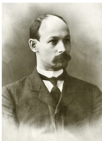
Рис. 7. Романов Нит Степанович (1871–1942 гг.) Fig. 7. Romanov Nit Stepanovich (1871–1942)

Первая общая неприглядная картина сибирских архивов была обрисована иркутским краеведом Н.С. Романовым (рис. 7). Он привел множество примеров их печальной участи, чтобы привлечь к ним внимание губернской администрации и населения. В своей статье «Сибирские архивы» местный историк-краевед описал истинное положение дел в регионах, расположенных за Уралом. Следу-