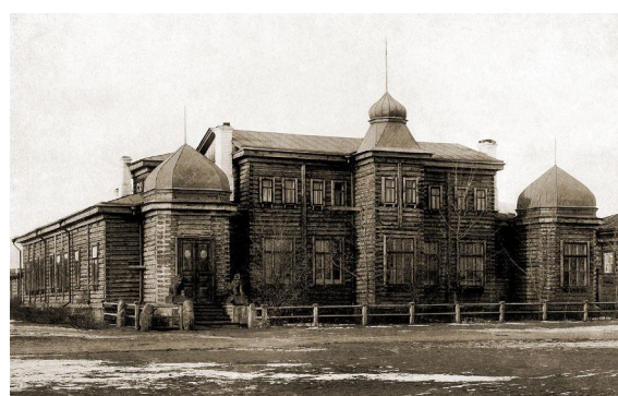
Рис. 3. Западно-Сибирский отдел Русского географического общества (Омск) Fig. 3. The West Siberian Department of the Russian Geographical Society (Omsk)