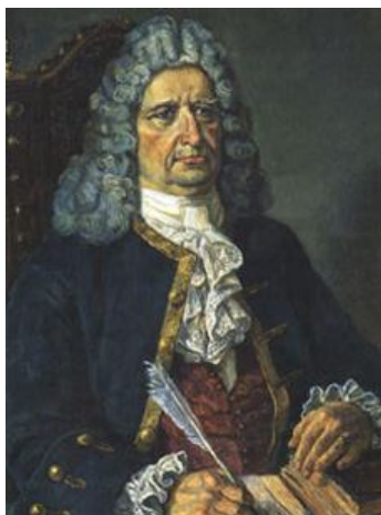
Рис. 1. Миллер Герхард Фридрих (1705–1783 гг.) Fig. 1. Miller Gerhard Friedrich (1705-1783)

Отношение к архивам начало постепенно меняться лишь на рубеже XIX–XX вв., когда интерес к историческому и культурному прошлому нашего края проявили авторитетные научные и учебные организации: Академия Наук, Археографическая комиссия, университеты. Они стали оказывать финансовую поддержку отечественным и зарубежным исследователям Сибири. Среди них особое место занимает историограф Г.Ф. Миллер (рис. 1),