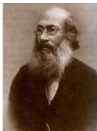
Рис. 5. Ровинский Павел Аполлонович (1831–1916 гг.) Fig. 5. Rovinsky Pavel Apollonovich (1831–1916)