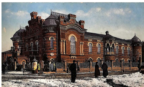
Рис. 2. Восточно-Сибирский отдел Русского географического общества (Иркутск) Fig.2. The East Siberian Department of the Russian Geographical Society (Irkutsk)

В 80-х гг. XIX в. сформировалась источниковедческая концепция областников, разработанная знаменитым этнографом и географом Г.Н. Потаниным (рис. 6). Согласно ей, «только наиболее пол-