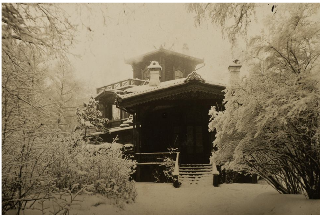
Рис. 5. Сукачевская роща Fig. 5. The Sukachev's Grove

Через неделю на первом этаже поселилась жена генерала Никитина, воюющего на фронте