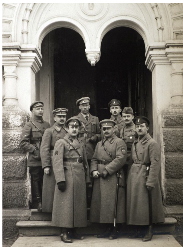
Рис. 4. Чехословацкое командование в России Fig. 4. Czechoslovak command in Russia

Компетенции русского командования чехословаки также совершенно не доверяли. Русские офицеры своим поведением, стремлением избежать строевой службы и тягой к роскоши подрывали боеспособность и моральный дух своей армии. Разумеется, сказанное нельзя относить ко всем офицерам, но к большей их части. Когда колчаковская армия отступала, один из боевых генералов констатировал, что при этом в тылу, в Омске так много офицеров, что окажись они на фронте, как бойцы, можно было бы надеяться на перелом. При этом русские войска имели и отличных офицеров. Отношения чехословаков с армией Колчака можно определить так: безразличие с нашей (чешской) стороны, враждебность, неприязнь или безразличие с российской. Наш уход на восток, в центр Сибири, где к лету 1919 г. разместились наши военные, произвел тяжелое впечатление на российские власти. Кажется, они до последнего не верили в реальность передислокации, хотя были заблаговременно уведомлены. Уход с фронта вызвал недовольство. Участились провокации против чехословацкого войска.