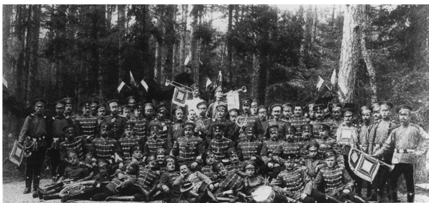
Рис. 4. 14-й гусарский Митавский полк. Групповое фото. 1908 г. Fig. 4. The 14th Hussar Mitavsky Regiment. Group photo. 1908

Конники попали под огонь трех легких и одной тяжелой батарей противника. Но остановить кавалерийскую атаку артогнем немцам не удалось – основная часть снарядов ложилась позади бригады. Лишь одна-