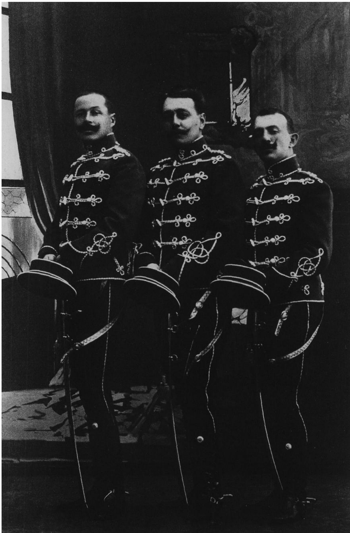
Рис. 8. Группа обер-офицеров 14-го гусарского Митавского полка в парадной форме Fig. 8. Group of chief officers of the 14th Hussars' Mitavsky Regiment in parade uniform