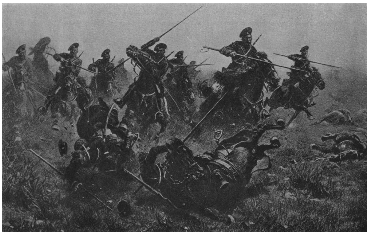
Рис. 6. Казачья атака Fig. 6. Cossack attack

После боя бригада собиралась у леса, откуда началась атака. Сказалось то, что своевременно не были обезоружены и эвакуированы в тыл немцы, сдающиеся в плен – они встретили огнем возвращавшиеся обратно те группы кавалеристов, которым не удалось прорваться на д. Швелице. Поэтому