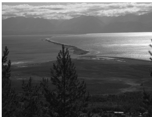
Рис. 1. О. Ярки Fig. 1. Island Yarki

Начиная с 1800 года, промысел контролировали около 15 рыбопромышленников, которые выезжали на все лето на Северный Байкал, а к Покрову возвращались по домам. Управляющими рыбными промыслами назначались доверенные купцами