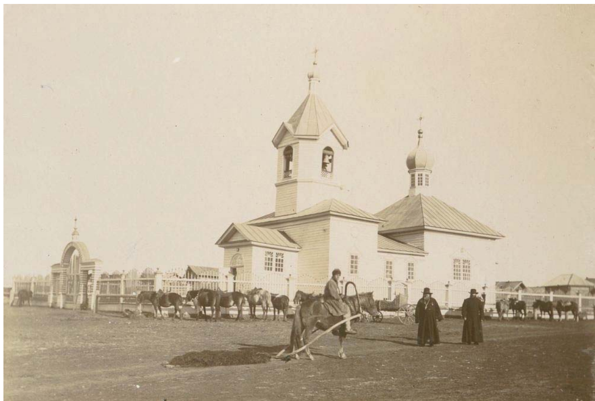
Рис. 2. Вид на церковь Св. Александра Невского (не сохранилась) и главную площадь с. Гордино Северное

28 мая красные (61-й Рыбинский полк) заняли д. Лазунскую (8 км от с. Гордино Южное), захватив пленных из 17-го Егерского полка и телефонную станцию 65-го Обского полка. Стремясь захватить с. Гордино Южное, батальон 61-го Рыбинского полка сделал глубокий обход, но был окружен, попав в засаду к белым. После жаркой схватки, потеряв 9 пулеметов, много