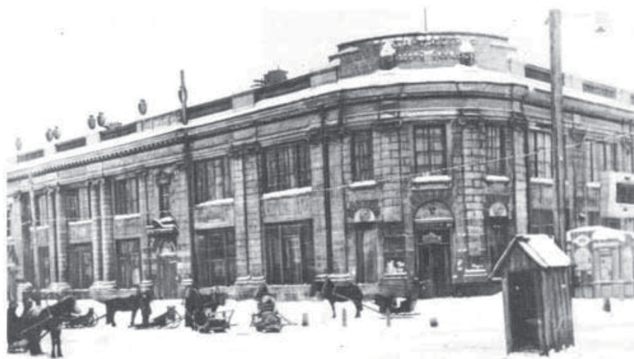
Рис. 1. Здание торгового филиала Богородско-Глуховской мануфактуры, г. Новониколаевск Здесь располагался 2-й Барабинский кадровый полк (Фотооткрытка)

17-й Сибирский стрелковый артиллерийский дивизион (1, 2, бат. по 4 ор. 3-х д.); 17-й Сибирский инженерный дивизион (1-я саперная рота и 1 кабельное отделение); Комендантская рота; Полевой подвижной лазарет; Перевязочный отряд; Автокоманда.