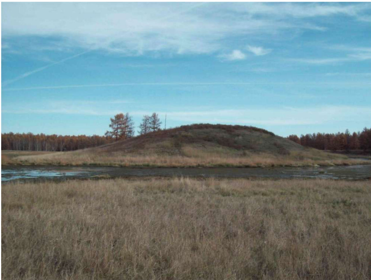
Рис. 2. Местность Булгуннях, одна из называемых координат местонахождения клада.