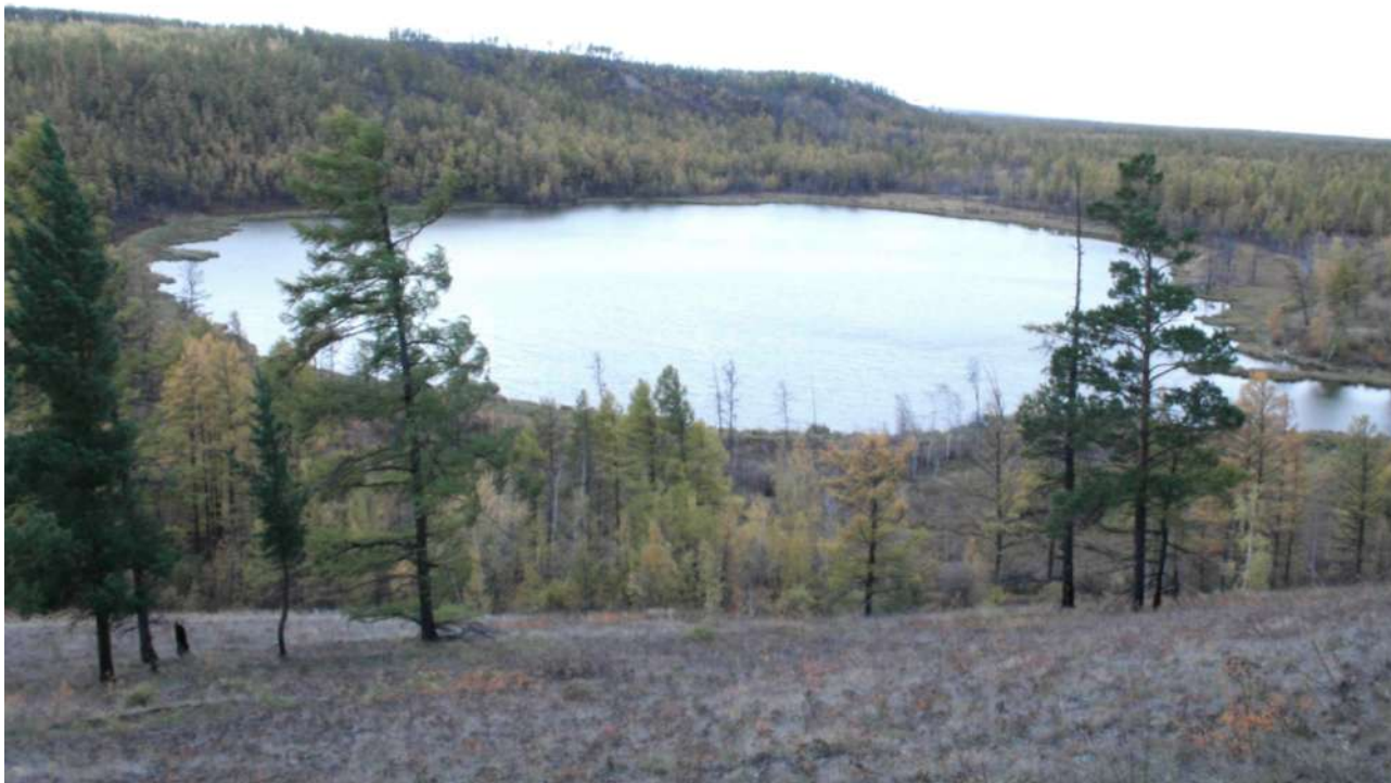
Рис. 1. Вид на озеро Багадал с северо-восточной стороны. Слева долина реч. Кумах-Юрях Fig. 1. View to the Lake Bagadal from North-East. The valley of River Kumakh-Yuryakh is on the left side