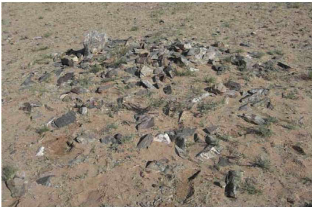
Рис. 11. Таван толгой. Могила № 11, вид с юго-востока