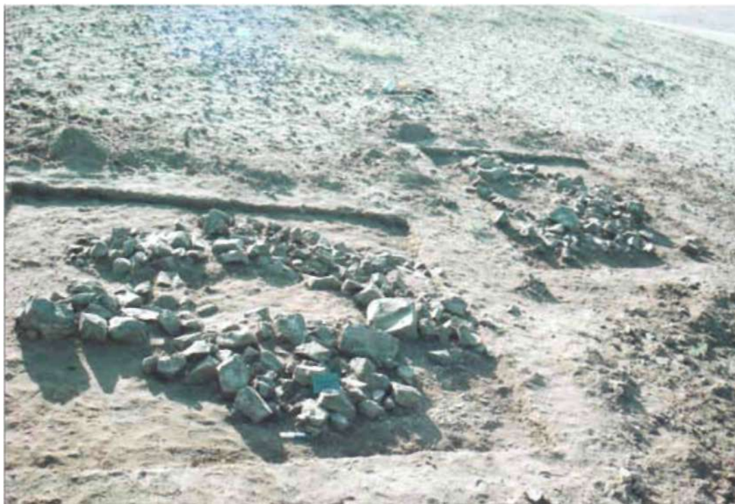
Рис. 1. Ханан бор. Могилы № 1 и 2. Кладки после расчистки, вид с запада