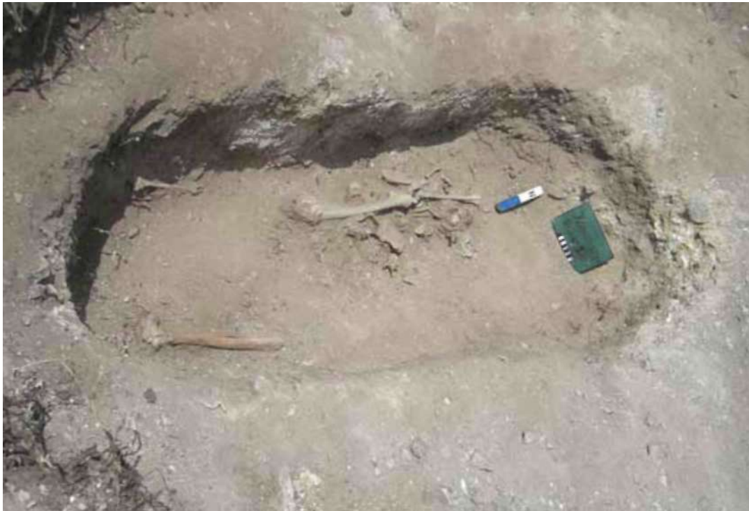
Рис. 2. Ханан бор. Могила № 1. Останки погребенного, вид с востока