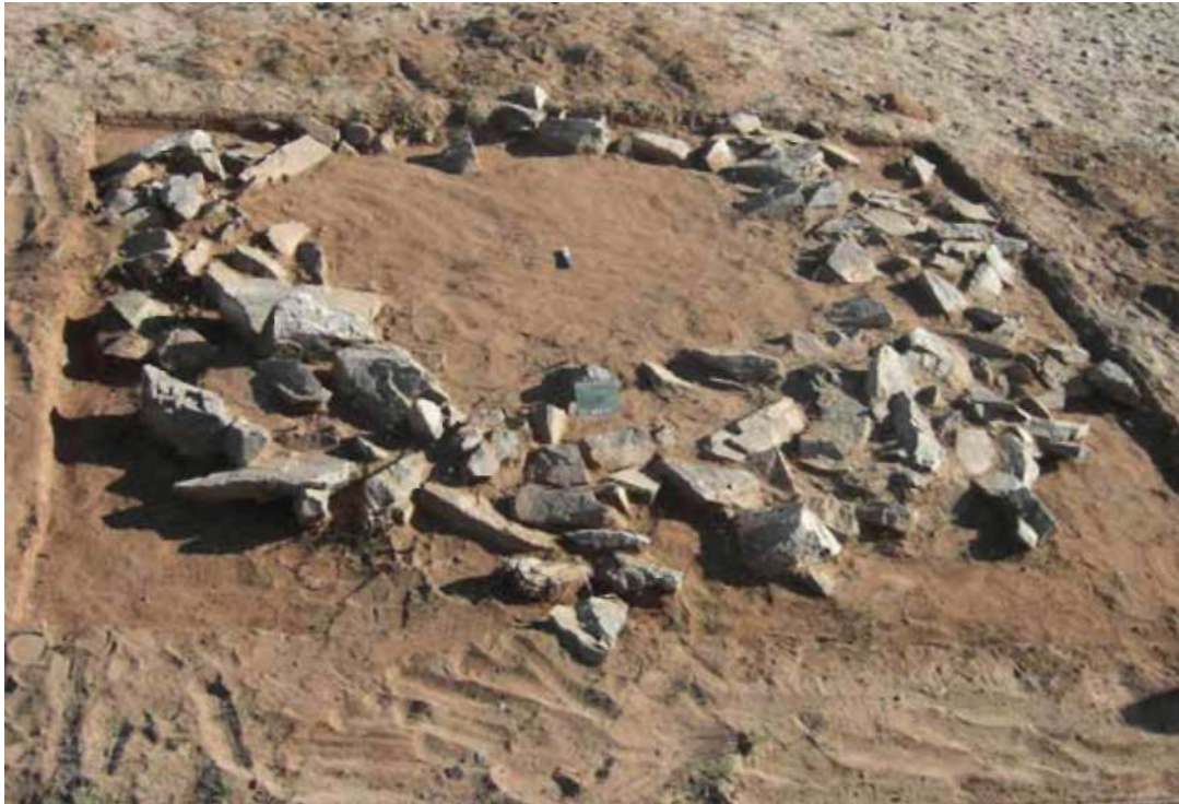
Рис. 8. Таван толгой. Могила № 10, вид с юга