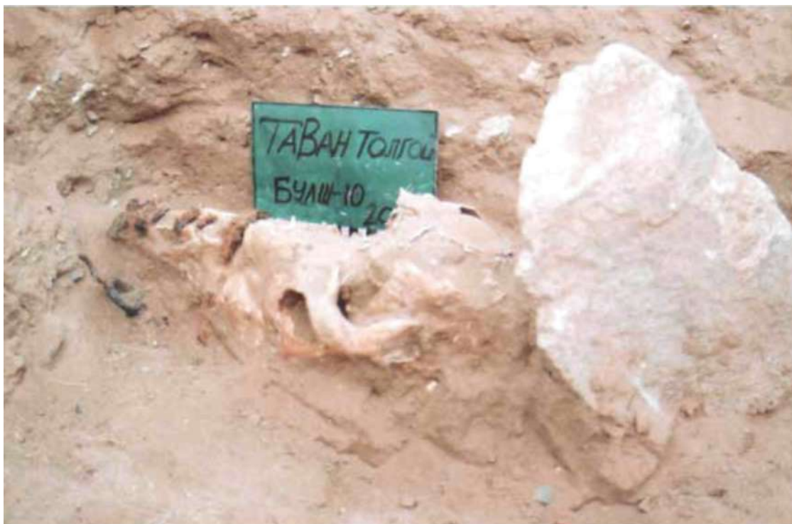
Рис. 9 Таван толгой. Могила № 10. Конский череп