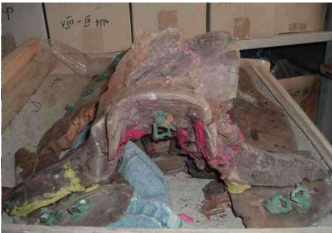
Рис. 7. Таван толгой. Могила № 9. Седло