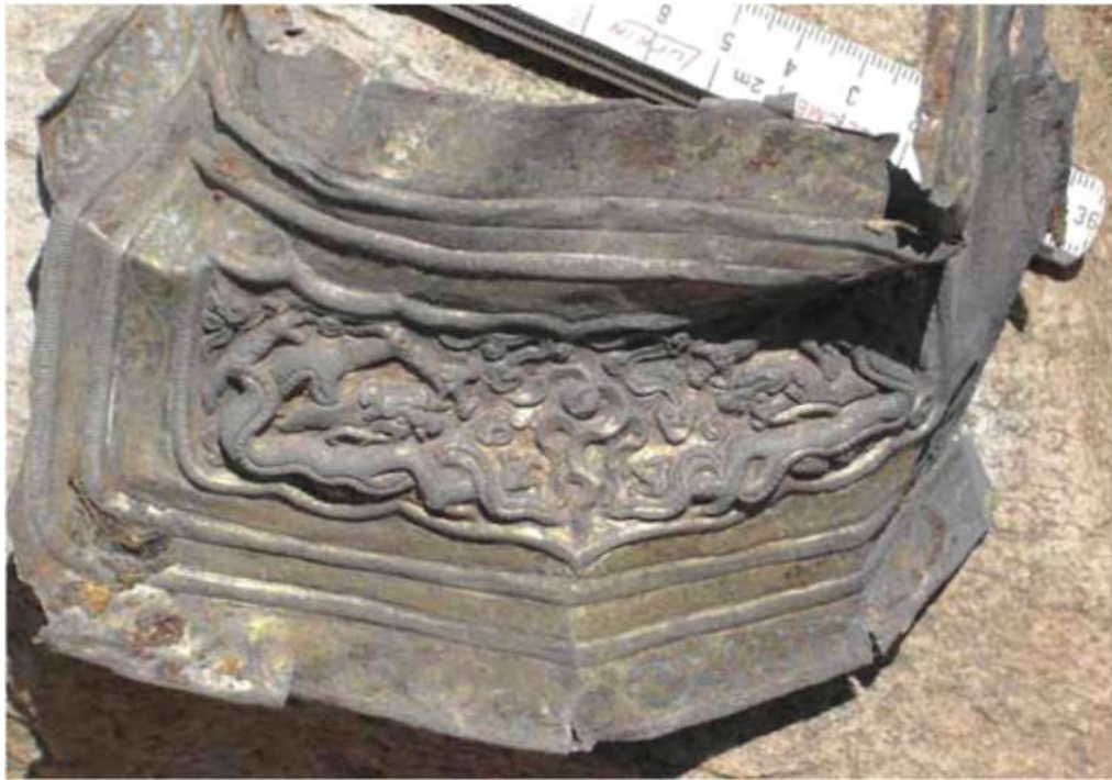
Рис. 10. Таван толгой. Могила № 10. Украшение седла