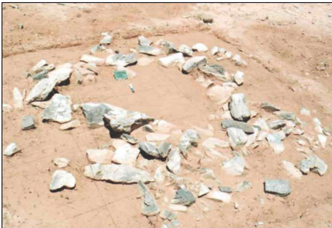
Рис. 5. Таван толгой. Могила № 9. Кладка после расчистки, вид с юга