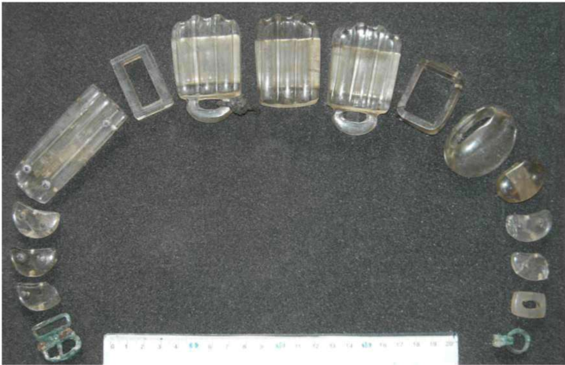
Рис. 12. Таван толгой. Могила № 11. Хрустальные украшения пояса — бэл