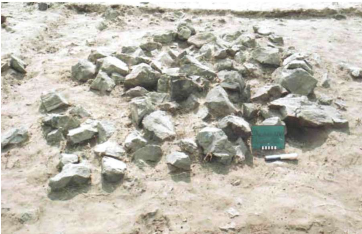
Рис. 3. Ханан бор. Могила № 7. Кладка после расчистки, вид с востока