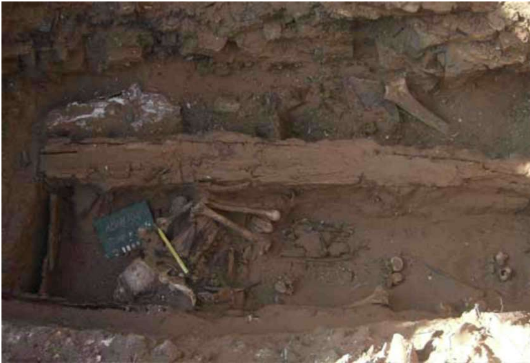
Рис. 6. Таван толгой. Могила № 9. Останки погребенного, вид с юга