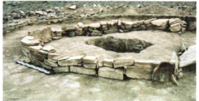
Рис. 22. Оградка могилы культуры тэви на территории Богд сомона Увврхангайского аймака