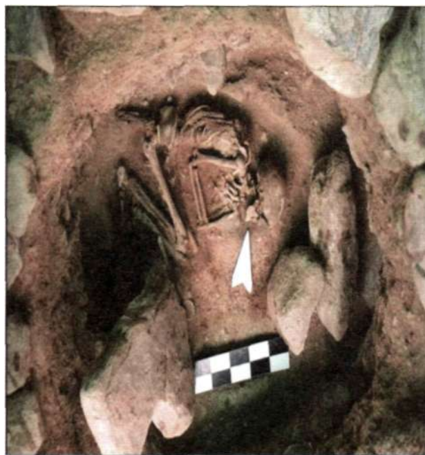
Рис. 10. Погребение мунххайрханской культуры на территории Мунххайрхан сомона Ховдоского аймака

мнения, относятся к мунххайрханской культуре. Из-за того, что погребения разграблены, невозможно было определить особенности обряда. Погребение № 1 могильника Хатуу даваа и погребения № 1 и № 2 могильника Улаанговь были детскими. Из четырех погребений, находящихся рядом в местности Улаанговь, три были разграблены и одно не тронуто. Радиоуглеродное исследование костей погребенных определило их возраст в пределах 1800-1600 лет до н.э. Ещё три погребения, относящихся к мунххайрханской культуре, были обнаружены к северу от центра сомо-