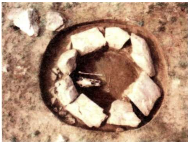
Рис. 15. Жертвоприношение в сопроводительном сооружении херексура на территории Мунххайрхан сомона Ховдоского аймака

менные насыпи диаметром в 1 м (рис. 15). Наличие 13 выкладок-лучей у раскопанного херексура, на наш взгляд, является не случайным. Число 13 имело особую символику у монголов как в древности, так и поныне. Ширина выкладок-лучей у центральной насыпи составляла 2 м, а у внешней оградки они сужались до 1 м. Обычно у херексуров внешняя ограда сооружается из одного ряда камней, а у херексура из Харговь внешняя ограда сложена из 2-3 слоев камней шириной 30-50 см.