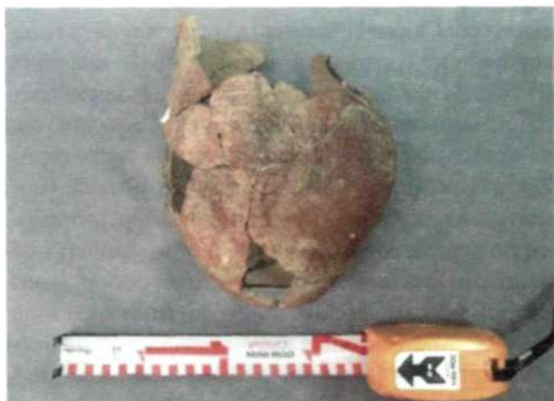
Рис. 5. Яйцеобразный сосуд из кургана афанасьевской культуры на территории Баян-Олгий аймака

ли данных культур проникли на Алтай примерно в одно время. Кроме того, в двух рядом расположенных захоронениях афанасьевской и чемурчекской культур в Хул уул и в Хаар хошууне обнаружены одинаковые по форме костяные наконечники стрел.