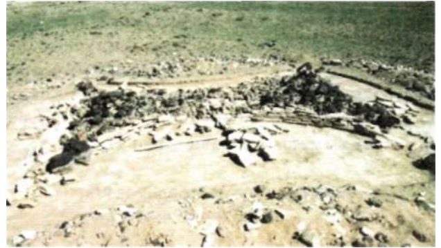
Рис. 20. Фигурная могила культуры тэви на территории Баянлиг сомона Баянхонгорского аймака

В начале-середине I тыс. до н.э. центральные и восточные регионы Монголии были заселены племенами, оставившими культуру плиточных могил . Эти погребения представляют собой ограду, ориентированную длинной стороной по направлению восток-запад и состоящую из вертикально установленных каменных плит. В центре оградки находилась могильная яма. Погребенный располагался на спине, вытянуто, головой на восток. Под голову и ноги умершего клали камень наподобие подушки. Иногда покойного укладывали в каменный ящик наподобие гроба, а чаще просто в яму, сопровождая его какими-либо предметами быта, и засыпали землей. Во II тыс. до н.э. на территории Хангайских гор эти племена соприкасались с народом, оставившим культуру оленных камней и херексуров. Восточная граница культуры херексуров и оленных камней проходит по территории Батширээт и Биндэр сомонов современного Хэнтийского аймака. Экономические и политические взаимоотношения носителей двух разных культур в настоящее время невозможно полностью выяснить. Однако наличие на одной территории плиточных могил, оленных камней и херексуров свидетельствует о том, что в ходе схожей хозяйственной деятельности представители двух культур непосредственно соприкасались, кочуя по территории друг друга и перенимая отдельные культурные ценности.