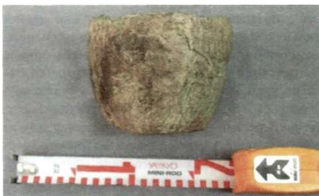
Рис. 8. Каменный сосуд из кургана чемурчекской культуры на территории Булган сомона Ховдоского аймака