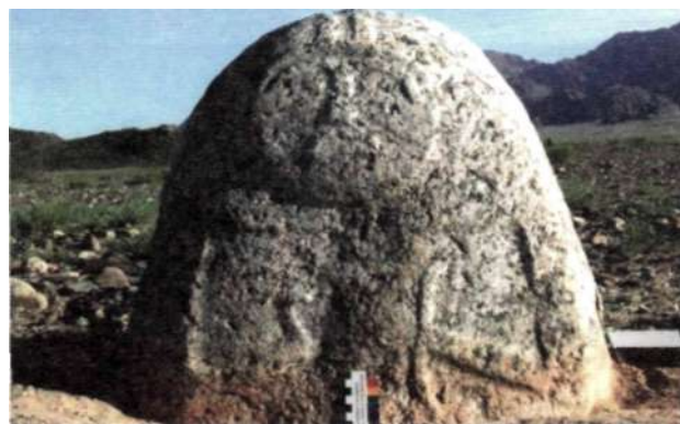
Рис. 7. Каменное изваяние у кургана чемурчекской культуры на территории Булган сомона Ховдоского аймака

ция в виде прохода и поставлена стела из тонного плоского камня, покрашенная красной охрой. В ходе исследований подобные погребения со стелами с восточной стороны кладки были встречены в долине реки Ховд и на берегах реки Буянт (Ковалев, 2005). Лабораторные исследования органических остатков из чемурчекских погребений на территории Монголии позволили определить их возраст концом II тыс. до.н.э. В чемурчекских погребениях чаще, чем в других захоронениях, встречаются каменные чаши (рис. 8). Всего к настоящему времени найдено три каменные чаши, из которых две целые и от одной сохранился только обломок.