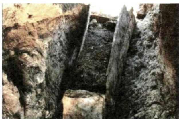
Рис. 24. Скальное погребение монгольского времени на территории Баянхонгорского аймака

связанно с принятием буддизма. При похоронах знати продолжали соблюдать скрытость. Умерших клали в саркофаги (бумбалы) и кремировали. Рядовых людей или оставляли на поверхности земли, не зарывая, или сжигали, или просто закапывали в землю. Однако продолжали сохраняться и прежние обычаи, связанные с жертвоприношением животных и выбором места для погребения. Для захоронений выбиралось место на горном склоне. Захоронение сопровождалось ритуальным убийством животного. При этом в могилы клали не целую тушу животного, а отдельные кости, символизирующие его. Несмотря на влияние буддизма на жизнь монголов, в их среде продолжали сохраняться традиции, унаследованные от предков. Среди них следует указать на обычай погребения усопших в расщелинах скал