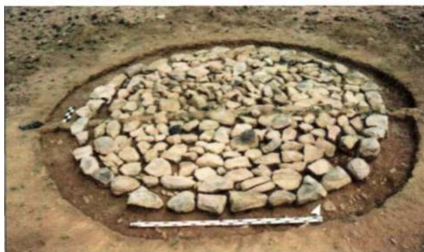
Рис. 9. Курган мунххайрханской культуры на территории Мунххайрхан сомона Ховдоского аймака

бении № 2 могильника Айна булак I, относящегося к чемурчекской культуре. В восточной части херексура в окрестности горы Хул на территории Улаанхус сомона Баян-Ульгийского аймака установлена каменная стела с изображением в верхней части человеческой головы. Точно такая стела найдена в восточной части ограды погребения Копя-2 на территории Казахстана.