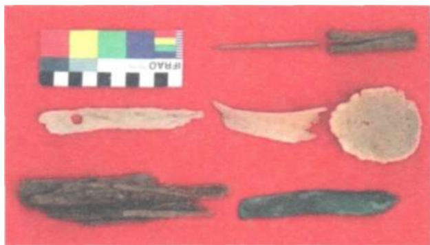
Рис. 11. Костяная ложка, бронзовый нож и шило из погребения мунххайрханской культуры на территории Мунххайрхан сомона Ховдоского аймака