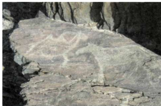
Рис. 1. Петроглифы палеолита на территории Манхан сомона Ховдского аймака

На территории Манхан сомона в местности Ишгэн толгой так же обнаружены наскальные рисунки верхнего палеолита. Это высеченные на скалах 150 рисунков, в том числе: человека -(1), лошадей -(18), коров -(13), оленей, лосей, антилоп -(19), верблюда -(1), козорогов — (17), диких баранов — аргали — (11), змей — (5), тигров — (3), различных знаков — (9) и 53 рисунка неясного изображения (рис. 1). Эти рисунки прекрасно отображают природное окружение человека периода верхнего палеолита и могут быть своеобразными