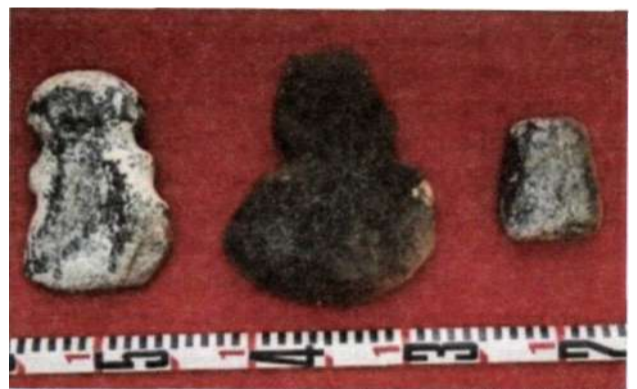
Рис. 17. Каменные орудия из херексура на территории Мунххайрхан сомона Ховдоского аймака