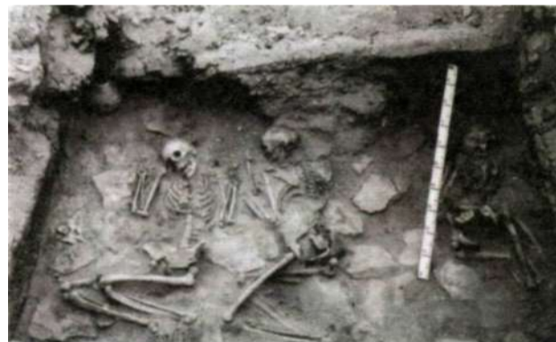
Рис. 2. Погребения чаднаманской культуры на территории Уве аймака