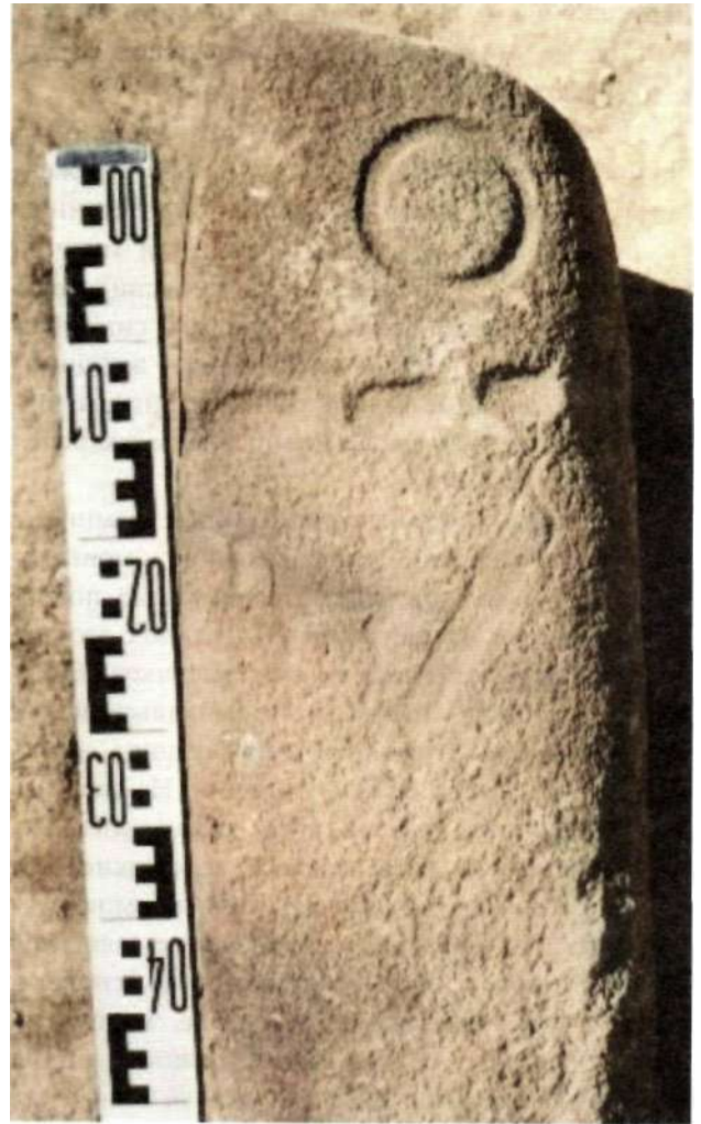
Рис. 16. Оленные камни из херексура на территории Мунххайрхан сомона Ховдоского аймака

В раскопанном херексуре было обнаружено в общей сложности пять оленных камней. Один был заготовкой, два камня были поставлены у наружной ограды, один найден под центральной насыпью, и последний в самой могиле. В могиле также найдены осколки керамической посуды и каменный топор (рис. 17). В отличие от ранее обнаруженных на территории Монголии херексуров, данное сооружение отличалось тем, что центральная каменная насыпь была соединена с оградой 13 каменными кладками-лучами в виде спиц колеса телеги, а с восточной стороны от ограды имелись 13 сопроводительных сооружений. В 20 м к югу от данного херексура находилось ритуальное сооружение с оленным камнем. При его раскопках кроме двух каменных орудий не было об-