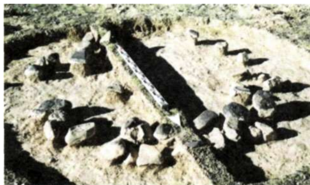
Рис. 18. Курган байтагской культуры на территории Уенч сомона Ховдоского аймака

На южной стороне Монгольского Алтая в эпоху поздней бронзы проживали племена, отличавшиеся по своим культурным традициям от населения, соорудившего херексуры. Об этом свидетельствуют археологические находки. В 2005 году нами исследованы захоронения в местности Улиастайн гол в горах Байтаг-богд на территории Уенч сомона Ховдоского аймака. На могильнике Улиастайн дунд дэнж-1 было выявлено семь погребений с кольцевыми надмогильными кладками. Кладки плоские однослойные диаметром 1,7-2,2 м (рис. 18). Хотя захоронения были порядком разграблены и разрушены, все же удалось выяснить, что погребенные располагались на спине головой на восток. Ноги согнуты, колени повернуты вверх (рис. 19). Подобные захоронения встречаются повсеместно на протяжении 200 км от сомона Уенч до горы Байтаг-богд. Они датируются 1400-200 гг. до н.э. и выделены нами в отдельную байтагскую культуру . Байтагские погребения встречаются на западе и юго-западе Монголии.