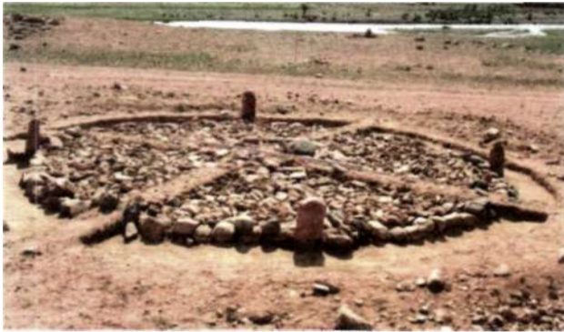
Рис. 13. Курган монгун тайгинской культуры на территории Мунххайрхан сомона Ховдоского аймака

носятся к позднему периоду монгун-тайгинской культуры. В могилах № 3 в местности Хатуу даваа и № 1 в местности Адуучын ам на территории Мунххайрхан сомона погребенные были обставлены плоскими овальными камнями, которые возвышались над краем могилы, и были перекрыты большими плоскими камнями. Сами кладки круглой (№ 1) и квадратной (№ 3) формы (рис. 13). Имеются сведения, что могильники подобной формы были раскопаны в 1960-х гг. В. Волковым и Ц. Доржурэном (Батмунх, 2000). В раскопанном нами захоронении № 1 могильника