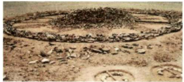
Рис. 14. Херексур с круглой оградкой и с оленными камнями в местности Харговь на территории Мунххайрхан сомона Ховдоского аймака

С 1990 года в Монголии раскопан целый ряд херексуров как круглой, так и квадратной формы, выделены две разновидности херексуров — погребальные и культовые (Эрдэнэбаатар, 2002).