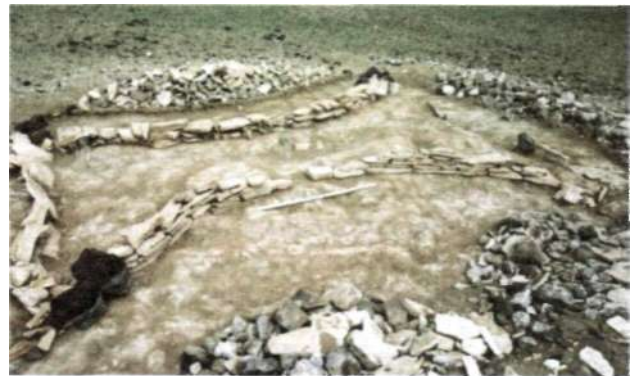
Рис. 21. Оградка фигурной могилы культуры тэви на территории Баянлиг сомона Баянхонгорского аймака

эти погребальные конструкции, проживало в тесном соседстве с племенами, оставившими культуру плиточных могил, херексуров и оленных камней. Ранее исследователи считали эти захоронения одной из разновидностей культуры плиточных могил (Волков, 1967). Современные методы и технология исследований позволяют утверждать, что