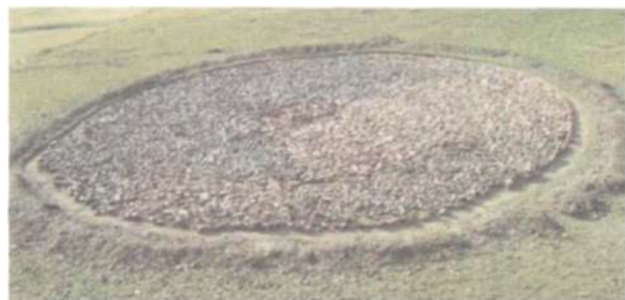
Рис. 12. Курган мунххайрханской культуры на территории Арбулаг сомона Хубсугульского аймака

Погребения Монгольского Алтая, относящи-