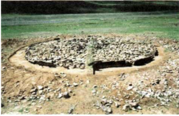
Рис. 3. Курган афанасьевской культуры на территории Баян-Олгий аймака