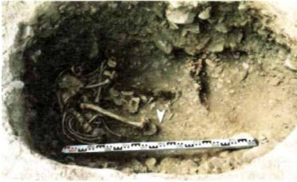
Рис. 19. Погребение байтагской культуры на территории Уенч сомона Ховдоского аймака