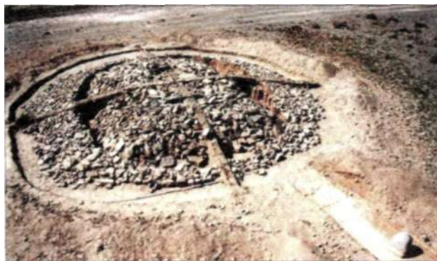
Рис. 6. Вид кургана чемурчекской культуры на территории Булган сомона Ховдоского аймака

В восточной части кладки погребения № 1 в местности Хэвийн ам сделана каменная конструк-