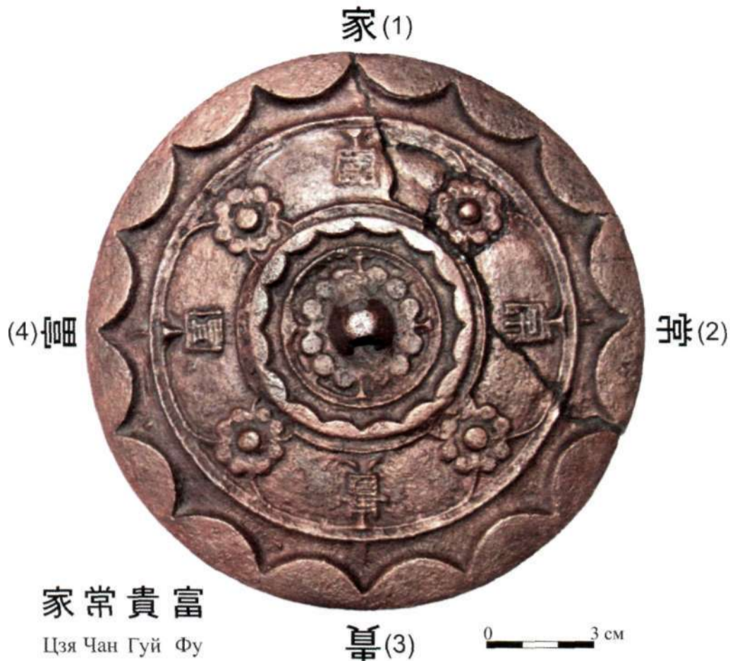
Рис. 3. Зеркало В-1 «с цветами и четырьмя иероглифами Цзя-чан-гуй-фу»

места спайки грубый, излишек припоя в результате перегрева в процессе работы «растекся» и закрыл часть орнамента. Внутренний край бортика зеркала оформлен орнаментом в виде продолжающихся полудуг. Во внутреннем орнаментальном поле крестообразно размещены четыре иероглифа, между которыми также крестообразно размещены цветочки. Шишечка-петля, расположенная в центре, также является основой цветка. Вокруг нее имеется бортик, оформленный орнаментом в виде продолжающихся полудуг. Иероглифы, расположенные на внутреннем орнаментальном поле зеркала, переводятся следующим образом: «цзя» - «потомство, семья», «чан» - «долголетие», «гуй» - «благородство», «фу» - «богатство». На русском языке эта фраза будет звучать так: «Пусть вашей семье (потомству) всегда сопутствует долголетие, благородство и богатство!» (рис. 3).