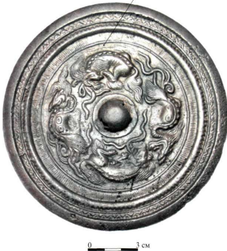
Рис. 2. Зеркало А-1 «с четырьмя драконами»

нусинского краеведческого музея. На одном из них от иероглифов остались только слабо различимые следы, на двух других иероглифы видны яснее, но все же слабо и неразборчиво (Лубо-Лесниченко, 1975: 106).