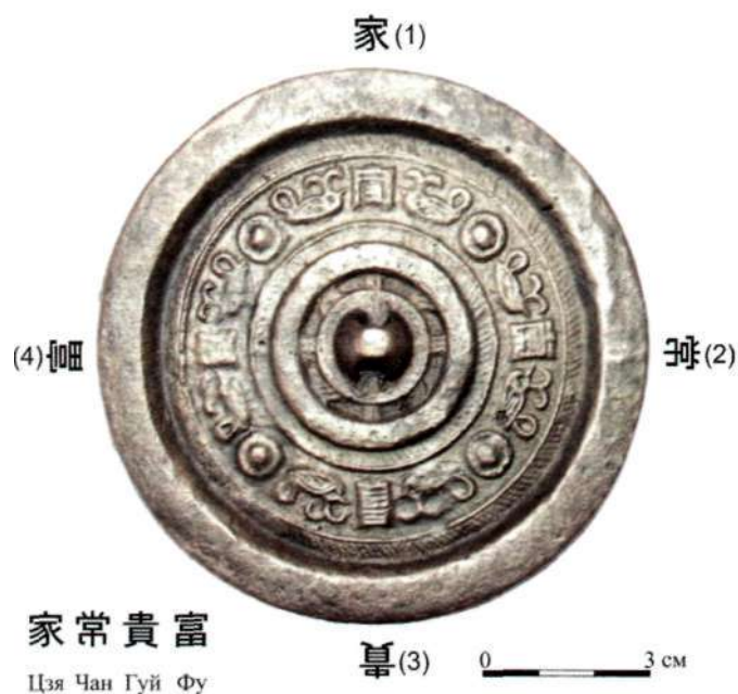
Рис. 4. Зеркало С-1 «с птичками, цветами и иероглифами Цзя-чан-гуй-фу»:

Таким образом, наиболее приемлемое время изготовления данного зеркала определяется нами эпохами Цзинь и Юань (XII - XIV вв. н.э.).