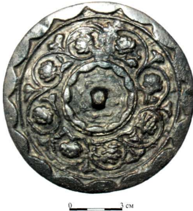
Рис. 5. Зеркало D-1 «с цветами и травами»*

бортик, оформленный в виде продолжающихся полудуг. В центре зеркала - простая шишечка-петля, окруженная слабочитаемым треугольным бордюриком (рис. 5).