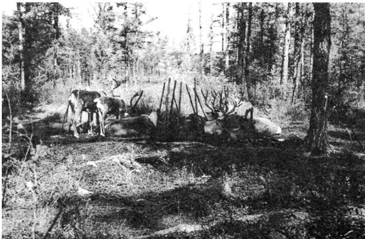
Рис.3. Дымокур на стоянке эвенка Черных Г.В., устье р. Кочковатой, фото автора 2003 г.

Из традиционных элементов на современных стоянках эвенков было отмечено присутствие 2-3 дымокуров для оленей и особого костра для приготовления пищи. Дымокуры играют важную роль среди сооружений летних стоянок. Эта роль вызвана их функцией: дым тлеющего костра отгоняет от оленей паутов, комаров и мошку. Эвенкийский дымокур представляет собой костер «гулувун» (уложенные «солнышком» по кругу брёвна),