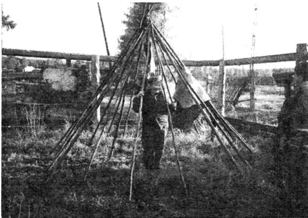
Рис.1. Каркас эвенкийского чума (информатор Н.Н.Копылова, с. Усть-Каренга, фото автора 2003 г.)

Часть населения пострадала в годы репрессий в отношении кулаков - более зажиточной части