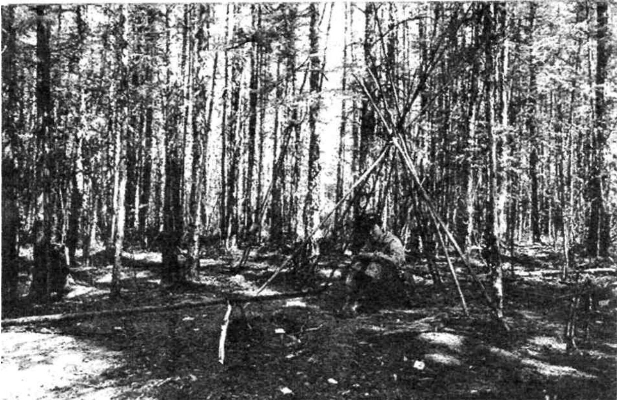
Рис.4. Эвенкийская конструкция костра для приготовления пищи, устье р. Каренга. Стоянка 70-х годов XX в, фото В.М.Ветрова 2003 г.

обнесённый поставленными по кругу жердями, поставленными в виде конуса. Костёр «гулувун» образуют 3-4 толстых бревна, которые уложены так, что концы их смыкаются. Высота жердей может быть различной от 0,5 до 1,0 м. Подсчитано, что для стада оленей в 40-50 голов ежедневно требовалось около 10-15 сосновых брёвен длиной 4-5 м и толщиной не меньше 25 см (Туров, 1990, с. 148). Дымокуры устраивались на ровной сухой площадке под навесом растущих деревьев, тень которых защищала оленей от дневной жары (рис. 3).